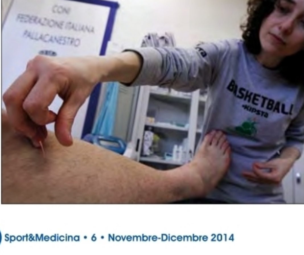
Figura 1 L'agopuntura si avvale di aghi sterili di 0,25-0,30 x 25 mm che vengono inseriti in punti specifici con un'azione su sistema nervoso. L'infiammazione è praticamente indolore e l'effetto percepito dal paziente durante il trattamento è di rilassamento.

28 Sport&Medicina • 6 • Novembre-Dicembre 2014